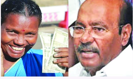
వైఫల్య భయానికి నిదర్శనం అన్నారు.

విల్లివాకం న్యూస్: విరుదునగర్ జిల్లా అరుప్పుక్కోట్టై కంచనాయకన్పట్టిలో గ్రామాభివృద్ధి పనుల ప్రారంభోత్సవంలో కె.కె.ఎస్.ఆర్. రామచంద్రన్ మాట్లాడారు. ఆ సమయంలో, దేవాదాయ శాఖ మంత్రి కెకెఎస్ఎస్ఆర్ రామచంద్రన్ జనవరి నుండి అన్ని కుటుంబ కార్యాలకు మహిళల అర్హత మొత్తాన్ని ఇస్తామని స్పష్టంగా చెప్పారు. పీఎంకే వ్యవస్థాపకుడు రాందాస్ తన ఎక్స్ సైట్ పేజీలో ఒక పోస్ట్ లో ఇలా అన్నారు. మహిళల అర్హత మొత్తం రూ.1000 అనేది డీఎంకే